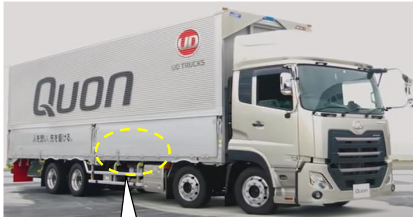
駐車ブレーキ用エアプレッシャーセンサ