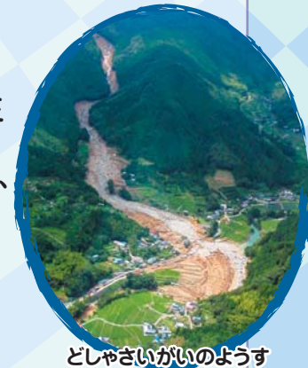
どしゃさいがいのようす

これまでの入賞作品は国土交通省砂防部Webサイトで見るができます。 http://www.mlit.go.jp/mizukokudo/sabo/kaiga_sakubun.html