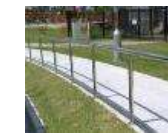
プロムナード整備