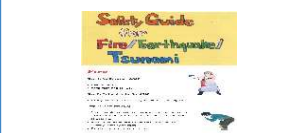
多言語防災ハンドブック等

※磨き上げを実施した観光コンテンツに関するもの (本補助金の活用等により並行して実施するものを含む)に限る