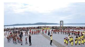
オープンエアを活用した 交流拠点の形成・イベント開催