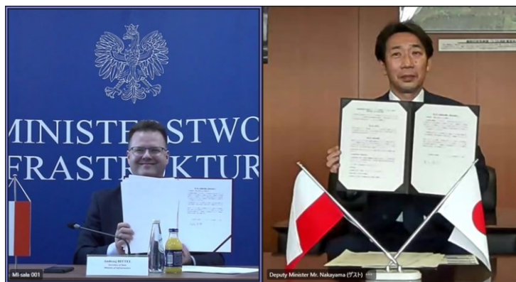
覚書オンライン署名式の様子