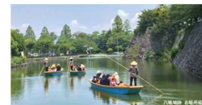
プライベート感を重視したツアーの形成