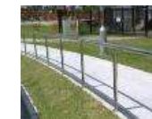
プロムナード整備