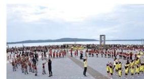
オープンエアを活用した交流拠点の形成・イベント開催