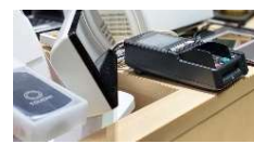
キャッシュレス対応