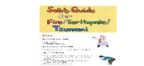
多言語防災ハンドブック等

※磨き上げを実施した観光コンテンツに関するもの(本補助金の活用等により並行して実施するものを含む)に限る