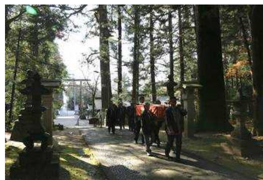
にのみやあかぎじんじゃ ごじんこう 二宮赤城神社の御神幸