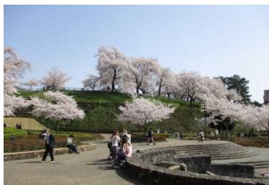
まえばしこうえん はなみ 前橋公園の花見