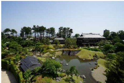
りんこうかく にほんていえん 臨江閣と日本庭園