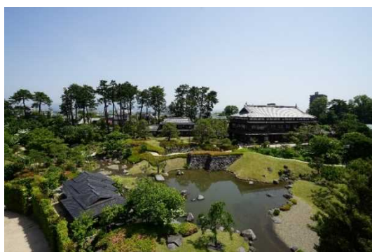
りんこうかく にほんていえん 臨江閣と日本庭園

本計画では、市内に残る歴史的建造物の保存活用・未指定建造物の調査に関する事業や、歴史情緒をさらに高めるための道路高質化・環境整備、まち並みのアクセントとなる歴史性を象徴する建造物等の復元・集客施設の整備等を位置付け、歴史的風致の維持及び向上を図っていくこととしています。