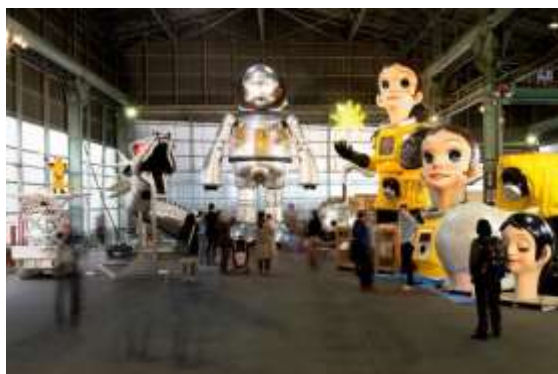
【MASK (MEGA ART STORAGE KITAKAGAYA)】