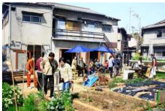
【みんなのうえん北加賀屋】

未利用の空き地をコミュニティ農園へ再生し、クリエイターとオリジナルの農具をつくるワークショップの開催など「アート×農」をテーマに、地域住民の交流を促進