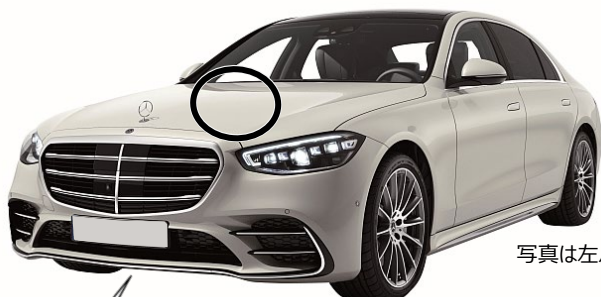
写真は左ハンドル仕様車