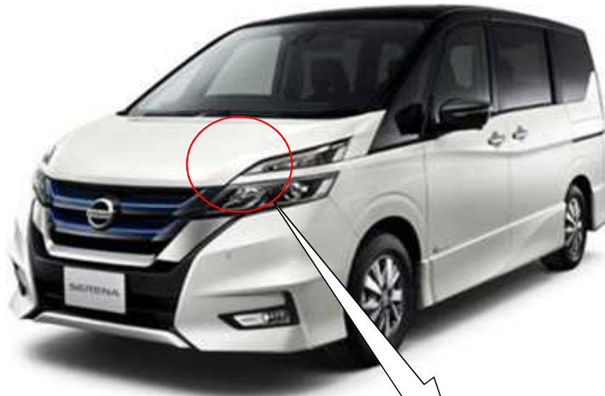
ビークルコントロールモジュール