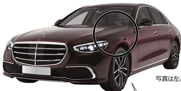
写真は左ハンドル仕様車