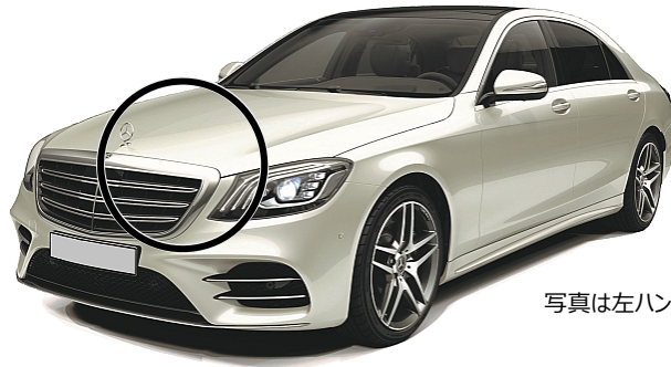
写真は左ハンドル仕様車