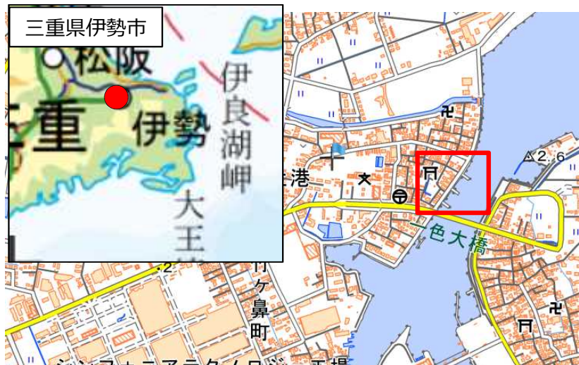
国土地理院地図（電子国土Web）( https://maps.gsi.go.jp )をもとに国土交通省作成