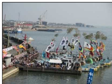
おんべだいせん 御幣鯛船歓送迎式典