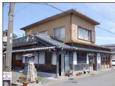
かみやしろ 神社・海の駅