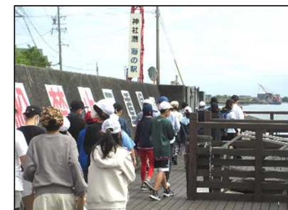
かみやしろ 神社港の社会見学