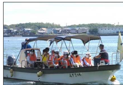
勢田川流域体験ツアー