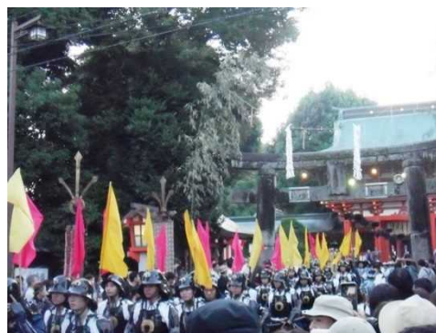
随兵による神幸行列（藤崎八幡宮例大祭）

熊本地震からの復旧・復興とともに、持続可能な地域活性化に向け、市民・地域・行政が一体となって、歴史的建造物等をはじめとする地域資源の保存・活用を推進しています。