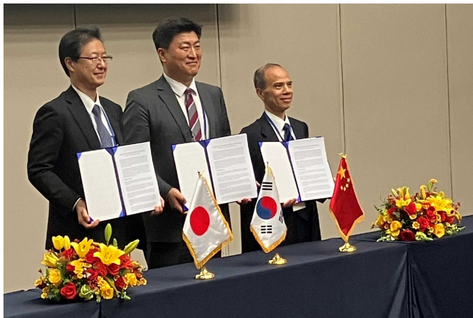
(日本 西村大臣官房技術参事官、韓国 南港湾局長、中国 楊水運局副局長)