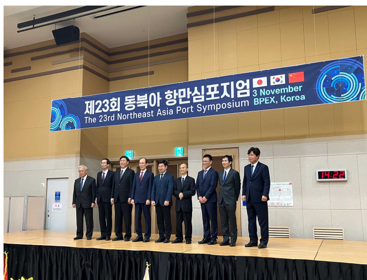
(各国代表の集合写真)