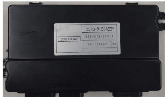
車両制御ユニット