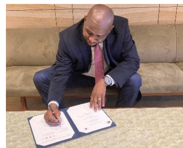
ムルコメン長官による署名