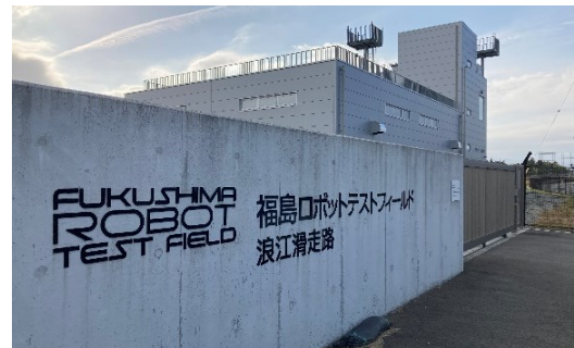
実証現場(福島ロボットテストフィールド)