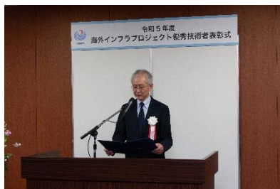
小澤委員長による祝辞