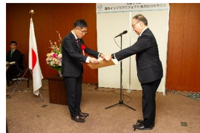
受賞者への賞状授与