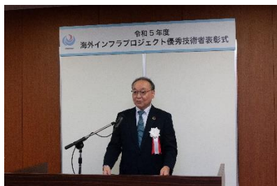
吉岡技監による祝辞