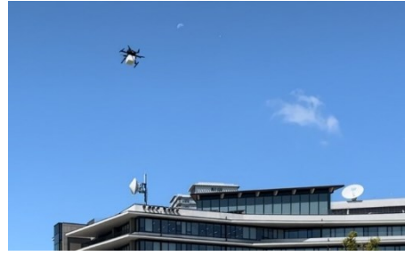
【第2回ドローンサミットの開催の様子】