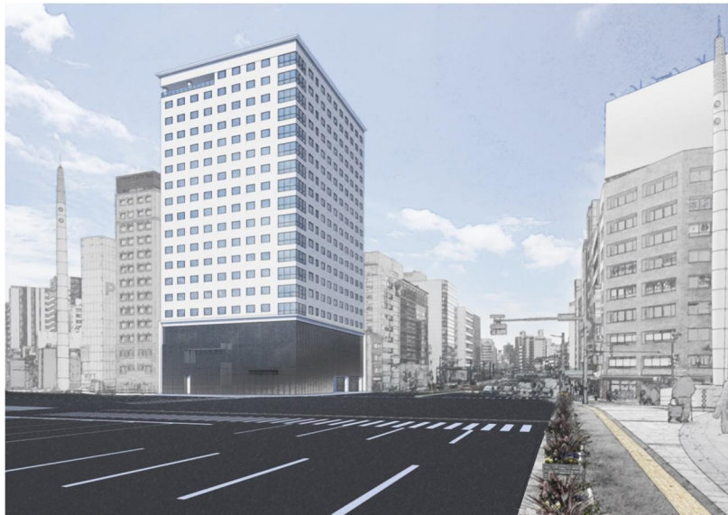
（仮称）広島市南区的場町1丁目ホテル計画外観（イメージ）