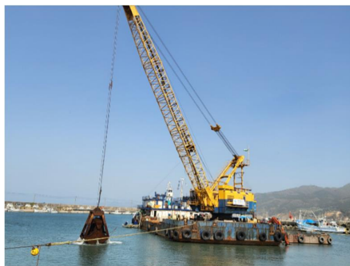
輪島港における啓開作業 <4月19日撮影>