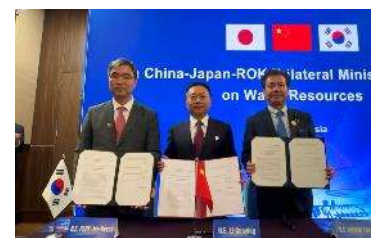
日中韓水担当大臣会合における 共同宣言の署名