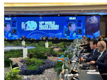
閣僚級会合における こやり政務官のスピーチ