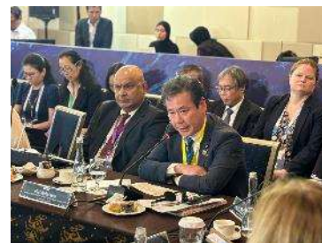
第23回 HELP における こやり政務官のスピーチ

こやり政務官は、5月19日、世界水フォーラムに併せて開催された「水と災害ハイレベルパネル（HELP）第23回会合」に出席した。会合には議長であるハン・スンス元韓国首相のほか、副議長であるバスキ・インドネシア公共事業・国民住宅大臣などが参加し、政務官からは、流域のあらゆる関係者による協働により立ち向かう「by ALL」の取り組みなどについて報告した。会合では、第10回世界水フォーラムや、バンドン精神水サミットの議論を国際社会に広める方策等について議論が行われた。