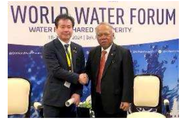
バスキ大臣との バイ会談の様子