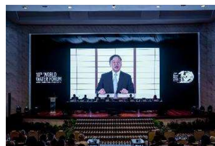
天皇陛下によるビデオ基調講演

首脳級・元首脳級・国際機関トップなどのハイレベルが参加して5月21日に開催された「バンドン精神水サミット」では、天皇陛下による「繁栄を分かち合うための水(Water for shared prosperity)」と題したビデオ基調講演が披露された。