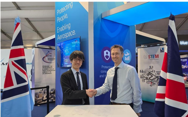
江口室長 と Bishton CEO