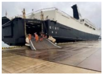
液状化により段差が生じたエプロン の応急復旧＜七尾港＞