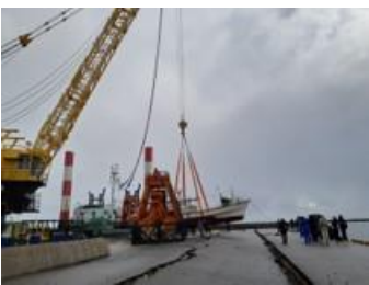
転覆した小型船の陸揚げ ＜飯田港＞