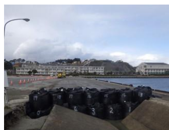
地震動により段差が生じたエプロンの 応急復旧＜宇出津港＞