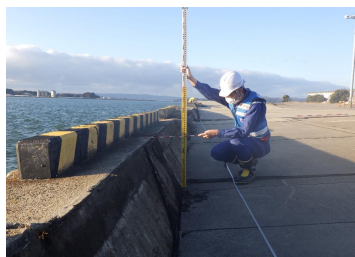
被害が生じた岸壁の点検 ＜七尾港＞