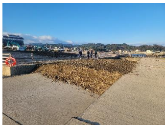
岸壁へのアクセス経路の確保 ＜輪島港＞