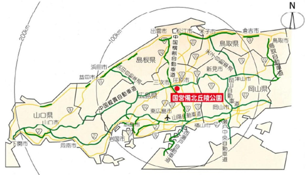
図：公園の位置（広域）