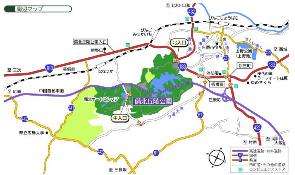
図：公園の位置（周辺拡大）