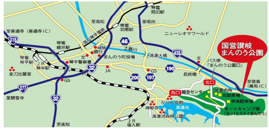
図:公園の位置(周辺拡大)