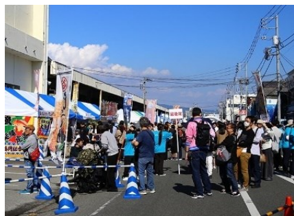
地域振興イベントの開催状況 (Sea級グルメ全国大会in津津)