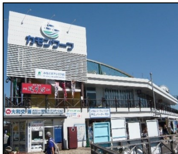
構成施設のイメージ (下関港、カモンワープ)