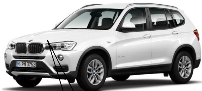
写真は左ハンドル車