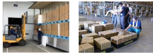
パレットの利用や検品の効率化