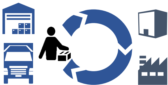
地域における配送の共同化