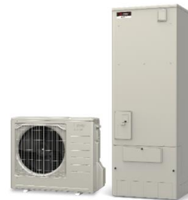
ヒートポンプ給湯機（エコキュート）