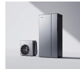
ハイブリッド給湯機