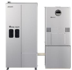
家庭用燃料電池（エネファーム）