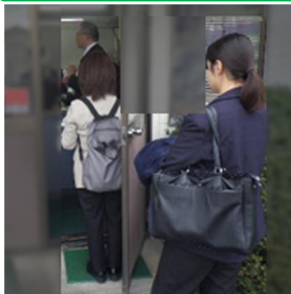
経済産業局、県と合同の 荷主への啓発活動