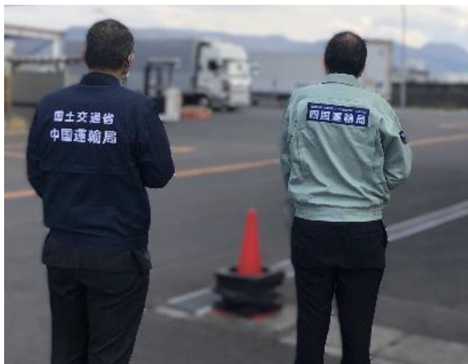
物流センター前で荷待ち状況のパトロール