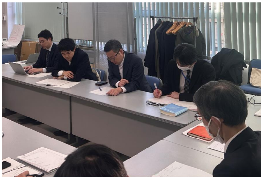
倉庫事業者へ悪質な荷主の情報ヒアリング （トラック担当、倉庫担当Gメンが合同で実施）