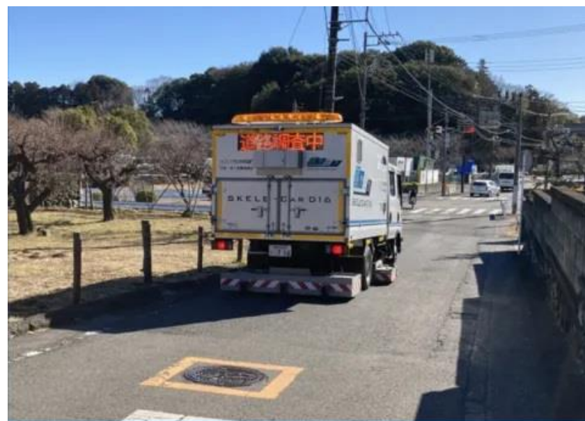
路面下空洞調査の様子 (空洞探査車による調査)