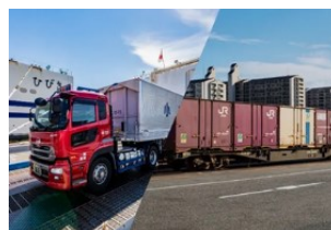
鉄道・内航海運へのモーダルシフトの強化

Step 1の検討結果を踏まえ、 地方自治体や産業団体・経済団体等 が協働し、 ① 新モーダルシフト （鉄道・新幹線、船舶、航空機、ダブル連結トラックなど） ② 地域の物流ネットワークの再構築 （共同輸配送、中継輸送など） の実現を目指す際の 物流拠点の整備費用 や 資機材の導入経費 などを支援。