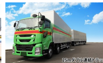
ダブル連結トラックを活用した共同輸配送や中継輸送