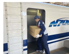
新幹線等の貨客混載