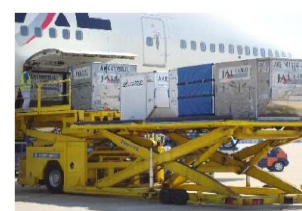
航空機の空きスペース等の有効活用