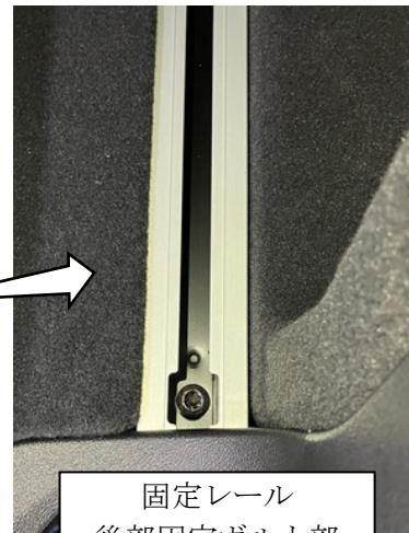
固定レール 後部固定ボルト部