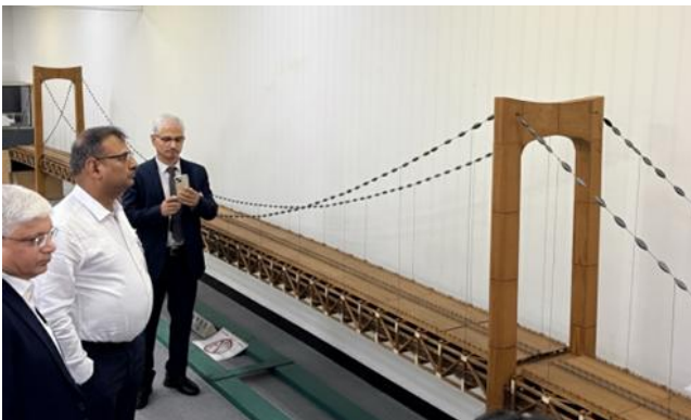
レインボブリッジ視察