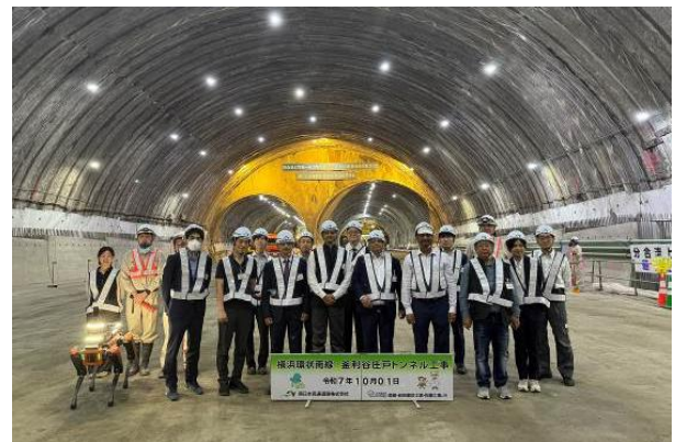
釜利谷庄戸トンネル工事視察