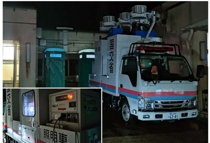
照明車からの電力供給により停電解消