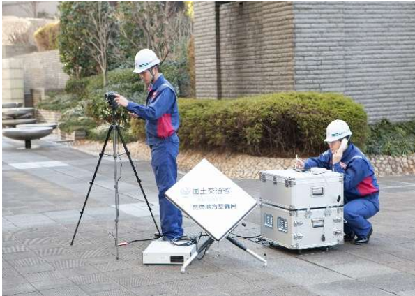
被災箇所をリアルタイムで映像配信 Ku-SAT