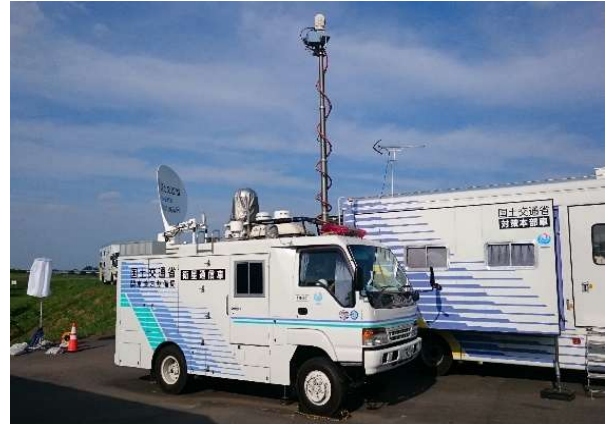
被災箇所をリアルタイムで映像配信 衛星通信車