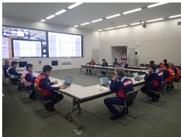
災害対策本部室等で配信映像を確認