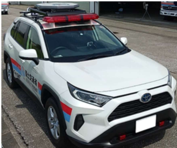
被災箇所をリアルタイムで映像配信 Car-SAT