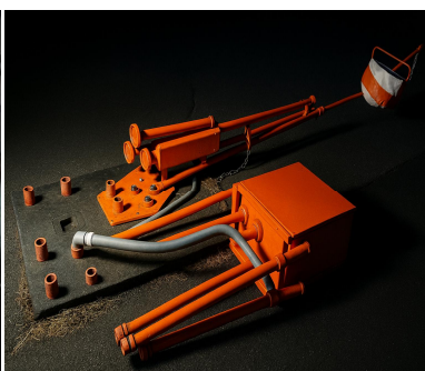
航空灯火電気施設の調査