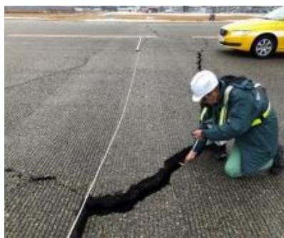
空港基本施設（滑走路等）の調査