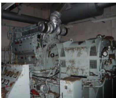
航空保安施設用予備発電設備の調査