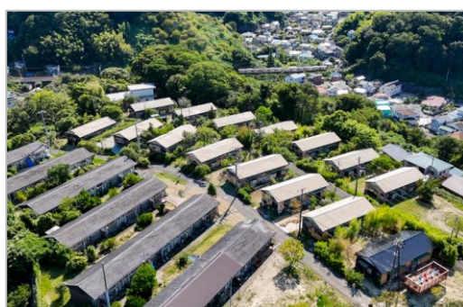
写真: 上空から見た田浦月見台住宅