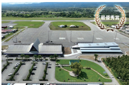
ホニアラ国際空港整備計画