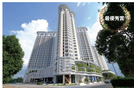
SORA gardens II