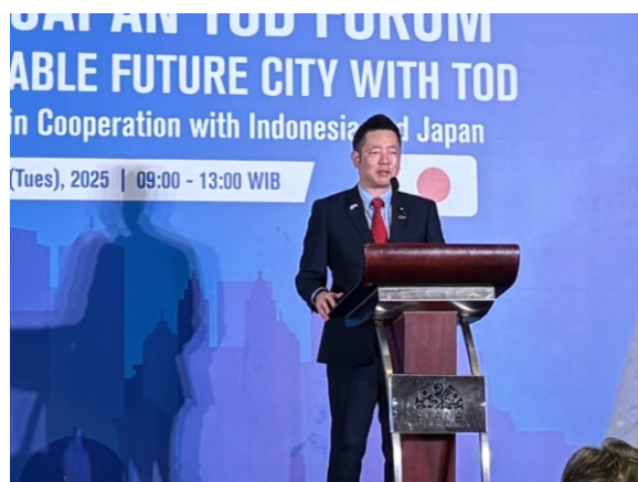
永井国土交通大臣政務官による挨拶