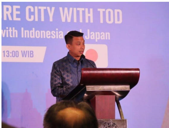
ロンニー インフラ調整府・住宅開発・住宅開発・ 居住インフラ担当次官による挨拶