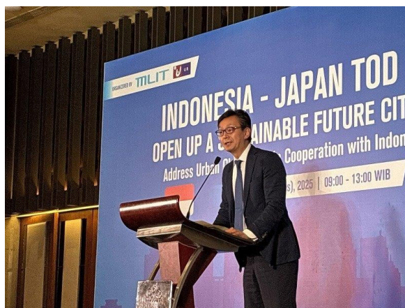
三浦国土交通省大臣官房審議官によるプレゼン