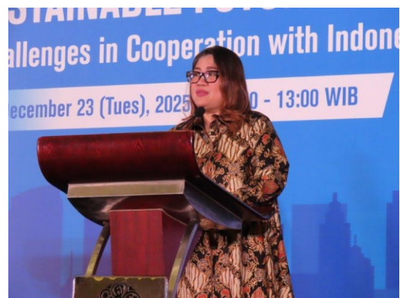
アティカ ジャカルタ州政府 地域開発計画庁 (BAPPEDA) 長官による挨拶