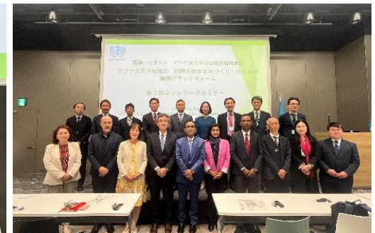
セミナー全体の登壇者の集合写真