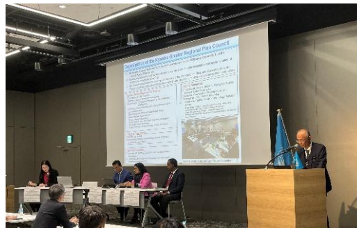
川埜九州地方整備局副局長による発表