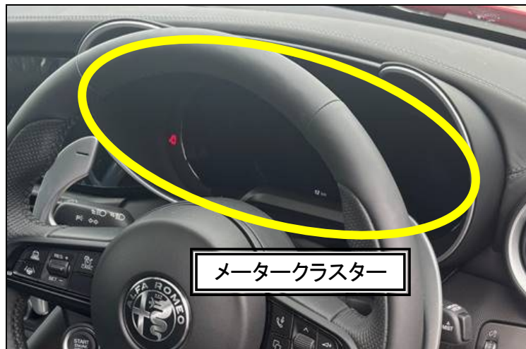
メータークラスター