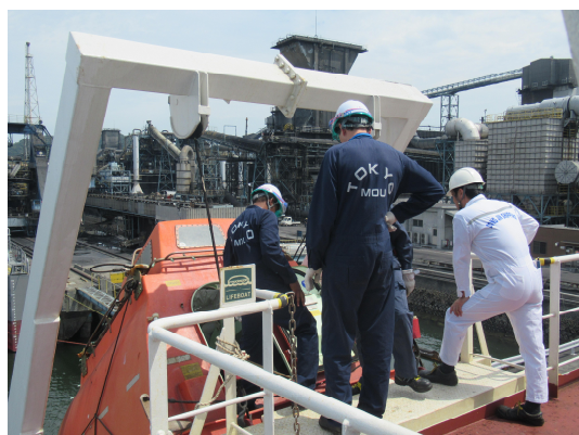
過年度の研修における講習及び PSC 実地訓練の様子