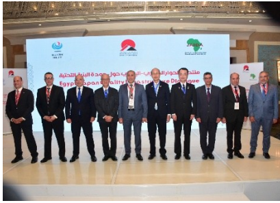
各組織代表の集合写真