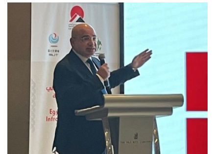
SCZone Shaikhon 副議長による基調講演