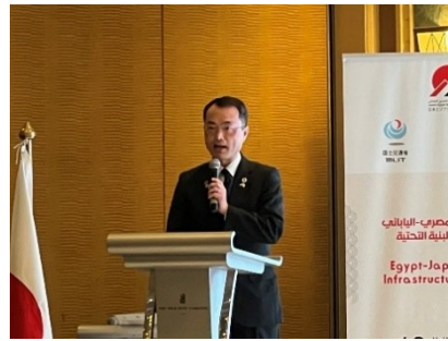
川村海外プロジェクト審議官挨拶