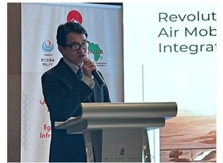
JAIDA 会員企業によるプレゼンテーションの様子