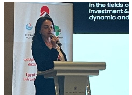
エジプト側民間企業によるプレゼンテーション