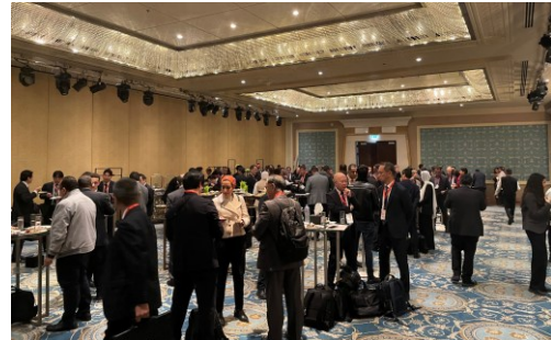
ネットワーキングの様子