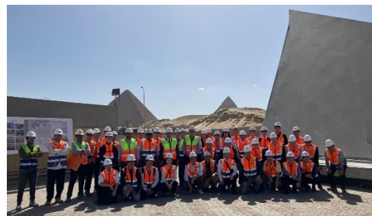
現場視察における集合写真