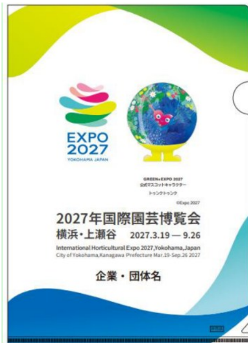
(参考) オリジナルクリアファイル