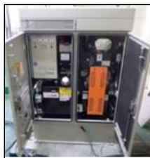
老朽化発電機の換装