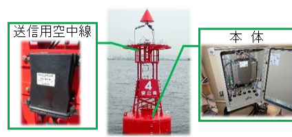
クラウド監視装置の導入