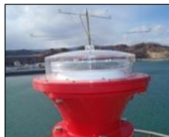
耐波浪型LED灯器等の整備