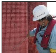
▲点検・診断 劣化を早期発見

航路標識の倒壊、損壊等の被害に対応するため、長寿命化のための整備を着実に実施し、航路標識の老朽化等対策を講じる。