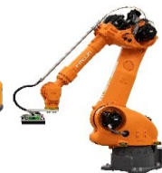
ピッキングロボット