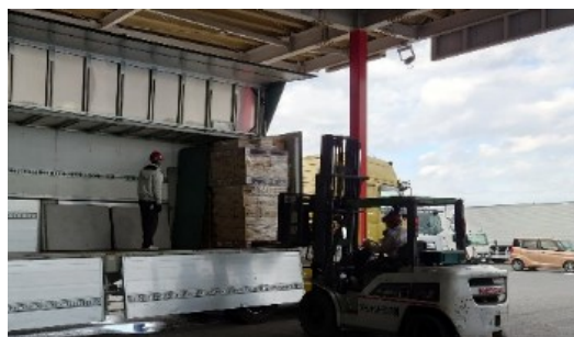
小口貨物積替施設

小口貨物のモーダルシフト需要等を踏まえ、トレーラー等に積み替えて効率的に輸送を行うため、小口貨物積替施設の整備を促進。