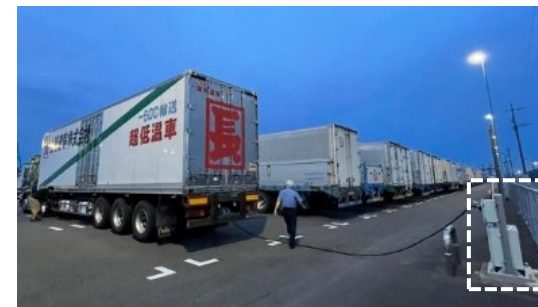
リーファープラグ

温度管理が必要な農水産品や冷蔵・冷凍食品のモーダルシフト需要に対応するため、リーファープラグの整備を促進。