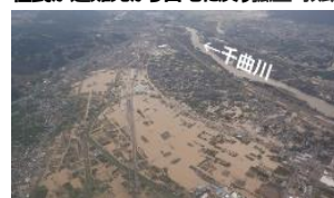
令和元年東日本台風（千曲川（長野県）） 大雨特別警報が大雨警報に切替えられた後 住民が避難先から自宅に戻り孤立・救助