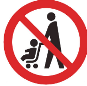
ベビーカー使用禁止マーク

ベビーカー使用者が安心して利用できる場所や設備（エレベーター、鉄道やバスの車両スペース等）を表しています。