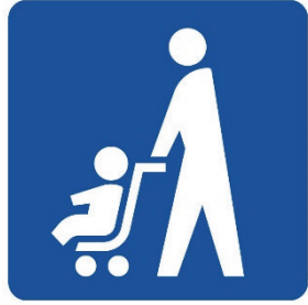
ベビーカーマーク

ベビーカー使用者が安心して利用できる場所や設備（エレベーター、鉄道やバスの車両スペース等）を表しています。